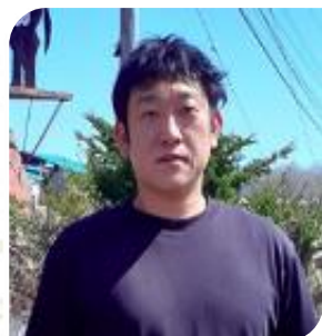
株式会社タケダ牧場 様