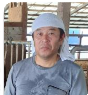
大坪畜産株式会社 様

発情、分娩、疾病兆候を管理することができ、且つ 導入コストが安価だったことに魅力を感じました。 24時間365日カプセルが体温を測定し、発熱を速やかに検知できるので体調不良の見落としが減り、非常に助かっています。